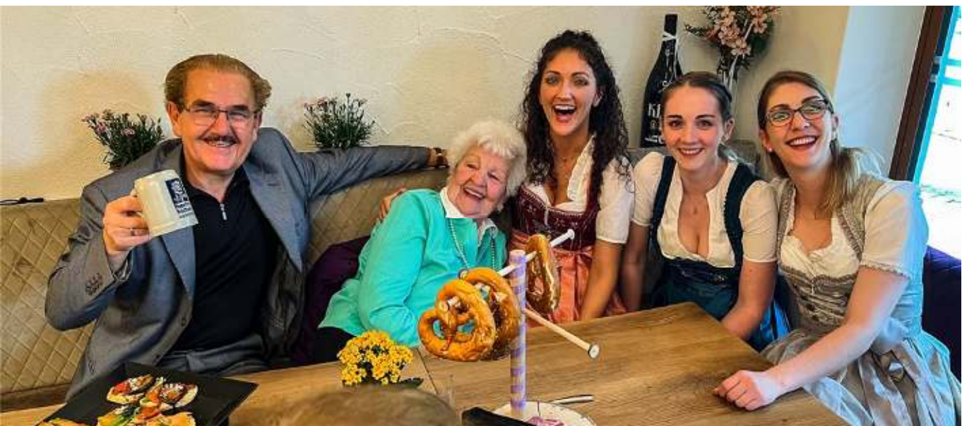
Nette Unterhaltung, gutes Essen und Trinken, hausgemachte Qualität: Im Bistro fühlt man sich wohl.

Täglich Frühstück, wechselnde Mittagsgerichte, Abo-Essen, Torten und vieles andere mehr