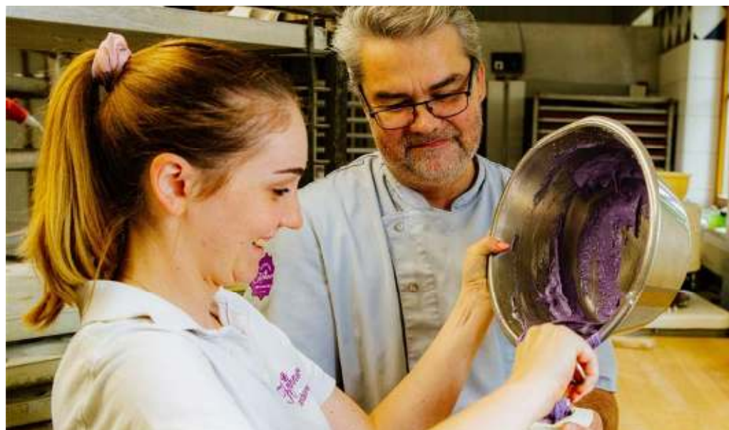
Die hausgemachte Qualität schmeckt man im Backstüberl.