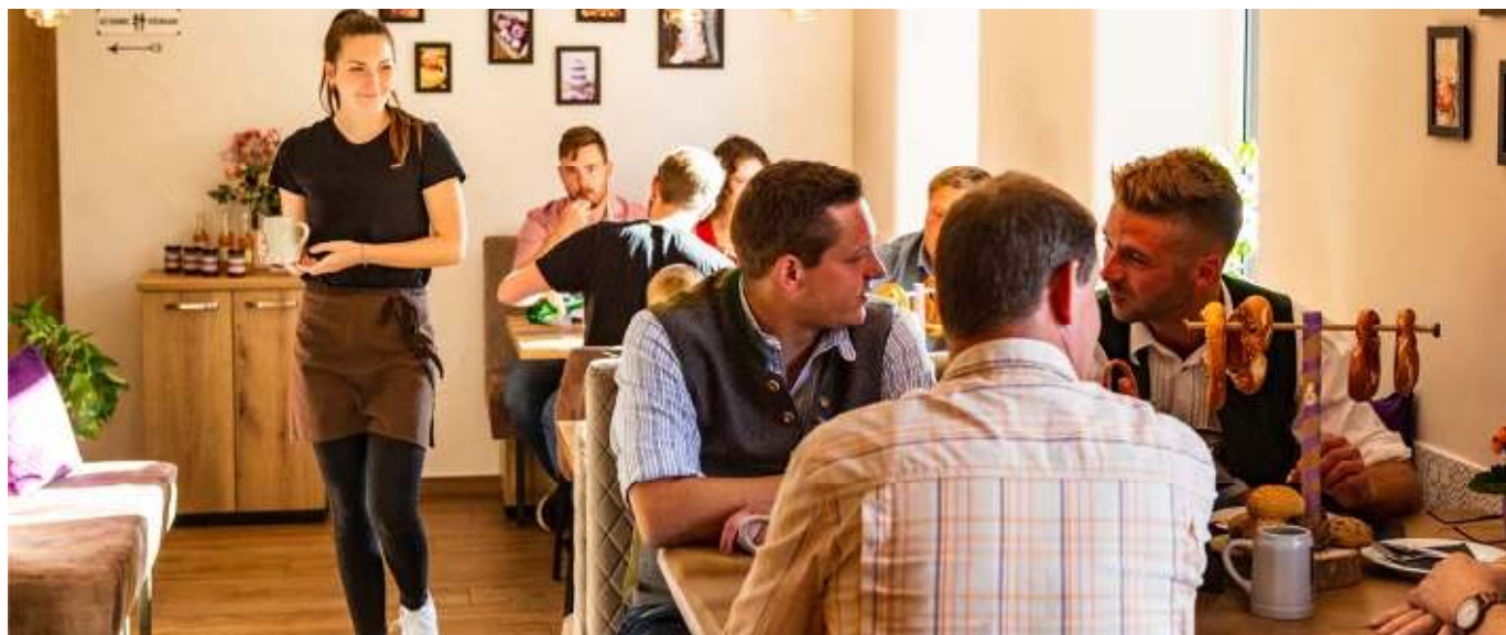
In angenehmen Ambiente feiern: Auch das ist in Krinner's Backstüberl möglich. Auf Wunsch gibt es Catering mit kalten Platten für Events und Feiern.