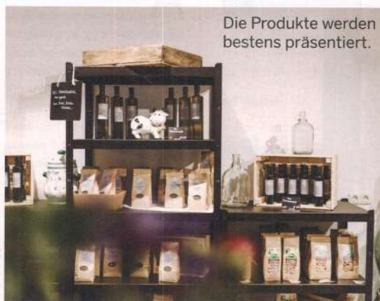
Die Produkte werden bestens präsentiert.