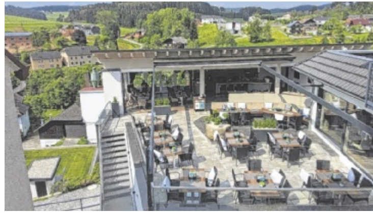
Der Süß Garden liegt hoch über Oberkappel und ist an heißen und auch kühlen Tagen einen Besuch wert.